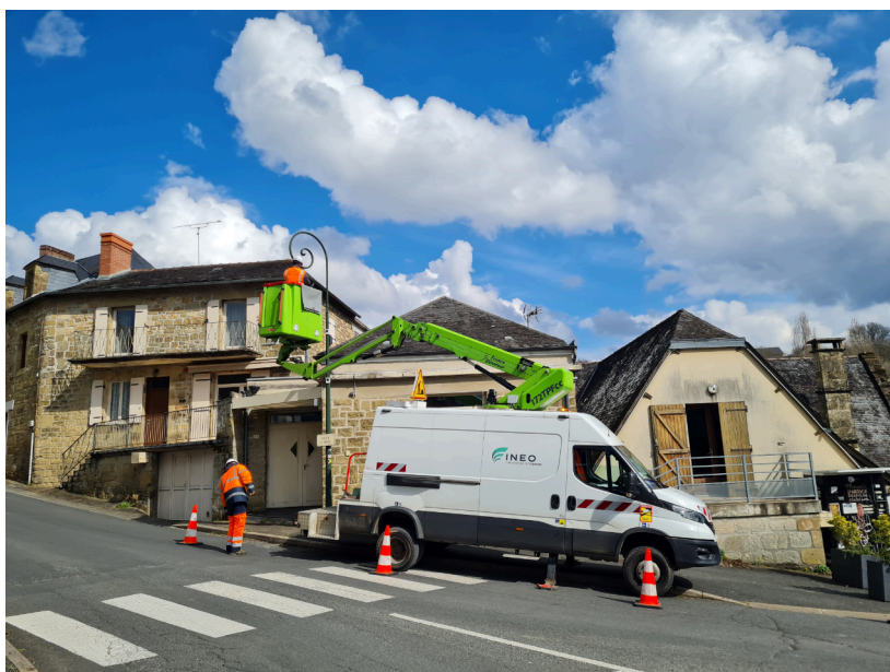
Travaux réalisés en 2025 par l'entreprise INEO

Sur tout le territoire corrézien (hormis les villes de Brive, Tulle, Objat, Bort-les-Orgues, Uzerche et Beaulieu), ce sont plus de 14.000 points lumineux qui ont été modernisés sur les 177 communes concernées par ce programme. Cela générera une économie de consommation d'environ 4 GWh (baisse de 5,3 GWh à 1,3 GWh), soit environ 1 million d'euros non dépensé.